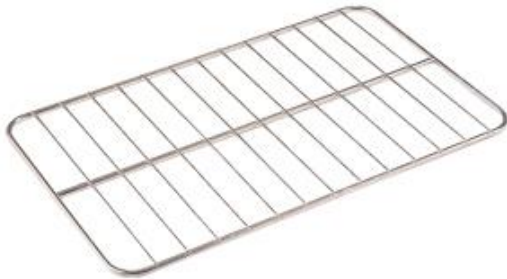
Distribución y exposición de alimentos - Gastronorm - Estantes de varilla - Estantes de varilla de acero inoxidable