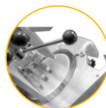
Cuchilla de acero 100Cr6